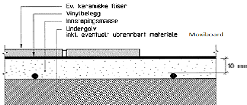
Fig. 4 b:

For golv med vanntett vinylbelegg eller membran som ikke tåler langtidstemperatur på 60 °C, skal betong/innstøpingsmasse avsluttes minst 10 mm over toppen av varmeeheten.